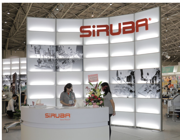
高林公司展示成衣縫製全自動化設備

值得一提的還有本屆展覽特別增設的智慧紡織專區，從智慧紡織品領域擴大延伸至「智慧製程應用」與「智慧解決方案」，藉以形塑智慧紡織體系，因應未來自動化與智慧化發展，快速滿足市場需求。