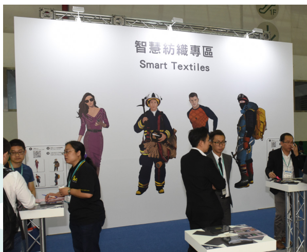
TITAS 2018新增智慧紡織專區