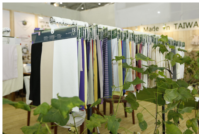
棉品實業推廣超長纖維有機棉對環境保護不餘遺力