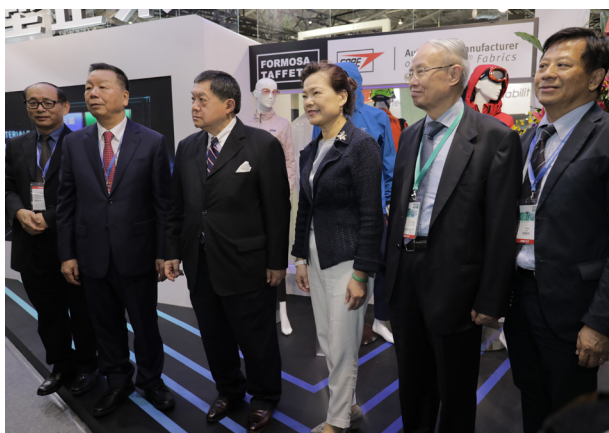
經濟部王美花次長參觀台塑企業

「憑藉著臺灣紡織業過去在機能、環保、智慧紡織方面投入的創新研發，以及完整的供應鏈，加上智慧衣趨勢，建構起高科技創新機能紡織價值鏈。」經