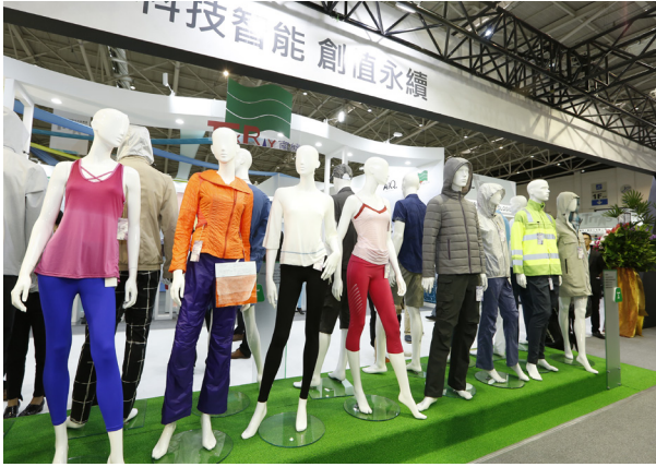
台塑企業整合旗下的台塑、南亞、台化與福懋推出「台塑企業館」