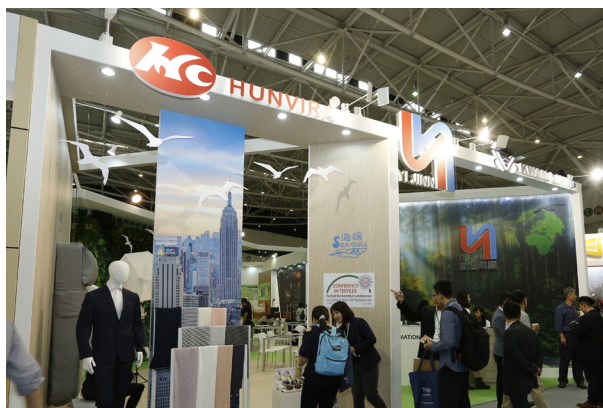
宜進以奈米科技開發出奈米銅抗菌纖維