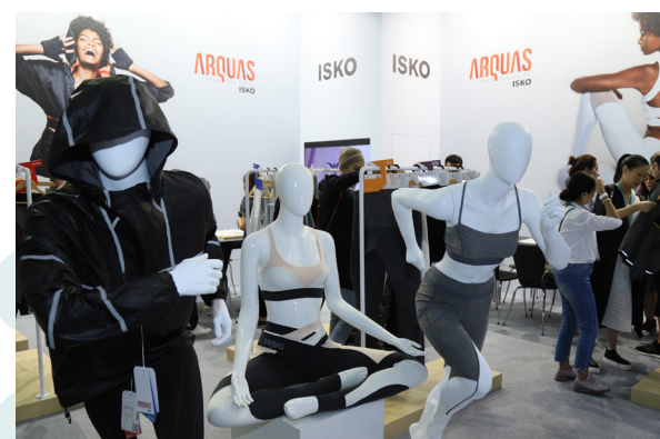
土耳其ISKO展出時尚與運動融合的牛仔布料