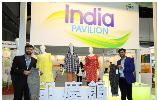
印度工商總會FICCI展出印度紡織品與服裝吸引參觀目光

還有集合織造、印染、後整理、檢測等研發、生產、貿易於一體的常熟中州，不僅是織造與加工的複合生產基地，更是中國高密輕量針織布生產廠家之一，以防寒服布料贏得客戶肯定。身為中國毛紡行業最具競爭力前十大的標竿企業山東康平納，也同樣帶來環保、節能與提升生產效率的優質服務與產品，共襄盛舉。其他來自日本、韓國、中國與歐洲的海外展商參與，也讓台北紡織展增色不少，不僅呈現多元匯聚的能量，更激盪交織出精彩的創新火花。