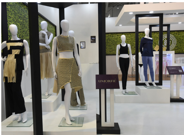
台南紡織與時俱進，讓傳統紗線有新面貌