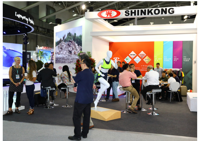
新光集團以友善環境與人道關懷，形塑全新的企業氛圍

燒，遠東新世紀也特別提出世界首創，針對廢棄紡織品回收再製的解決方案「FENC® TopGreen® rTex」，透過化學回收過程，溶解掉聚酯、過濾染料、將纖維素轉化成燃料棒，作為再生能源使用，讓原本只能當成垃圾掩埋的廢棄紡織品，重新找到新價值。