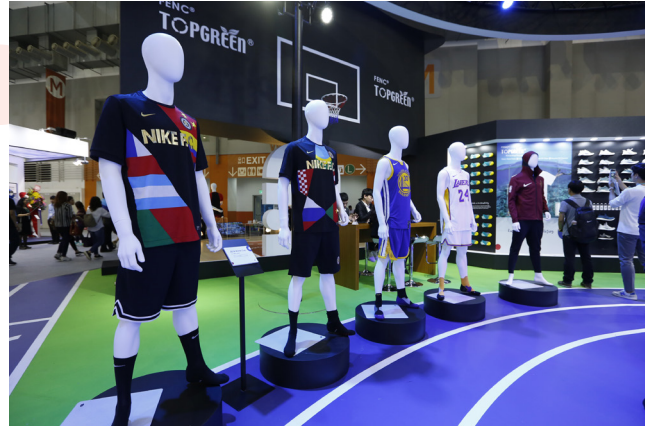
遠東新世紀充分展現對綠色永續的重視

高丹尼嫻縈纖維，可應用於航太工業；不織布專用嫻縈纖維，因為親膚性佳可作為醫療美容素材；此外，台化的耐隆更以機能性材料合成技術滿足輕量、流行、時尚、機能的市場需求。值得一提的是，台化與福懋興業特別合作開發耐隆回收環保布種，展現對環保的高度重視。而今年，福懋興業推出的智慧衣，充分運用科技織物原理，能連結手機APP，除了發熱控溫及彩色LED顯示功能，更具備安全防護及養身健康的特色，不僅獲得市場青睞，更讓紡織品應用再升級。