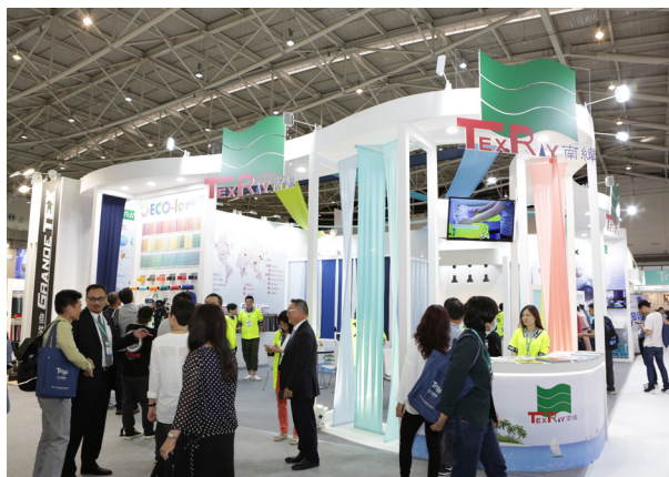
南緯深耕智慧衣創新應用