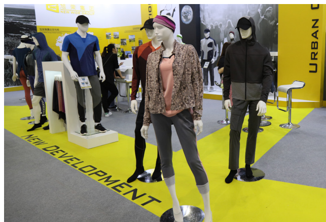
旭榮集團展出兼具機能與設計服飾成為會場焦點

結合科技與自然，菁華工業始終掌控生產流程，提供創新優質的圓編針織機能性布料，垂直整合上下游的技術，為織廠、假撚廠、染整廠，以及成衣廠設立了先進的標準，滿足國際品牌的需求。菁華工業推出新一代節能環保的L.I.T.® (Low Impact Technology) 紗，在染整過程中能有效減少所需的水、電等能源及