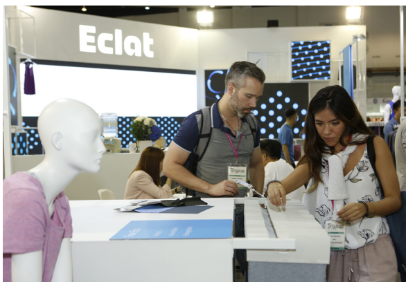
儒鴻專精研發與生產高機能布料與服裝