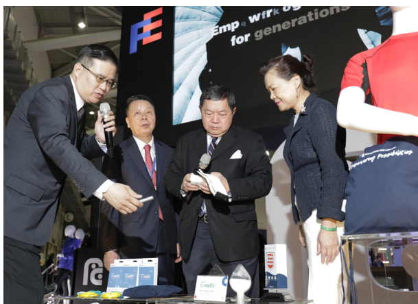
經濟部王美花次長參觀遠東新世紀

濟部王美花次長點出優勢，也特別肯定台北紡織展對於推升臺灣紡織產業動能的重要貢獻。